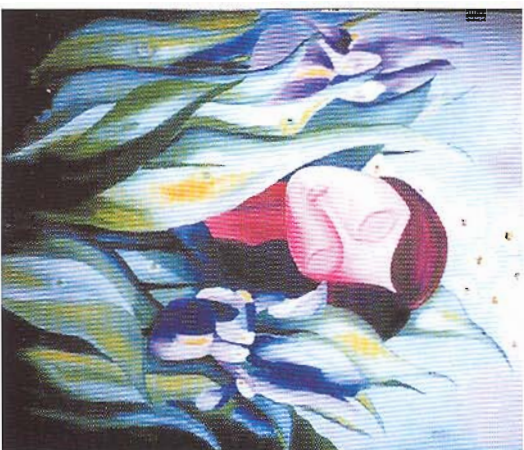
Óleo sobre tela, 60x50 cm

Representada em diversas colecções particulares na Alemanha e outros países